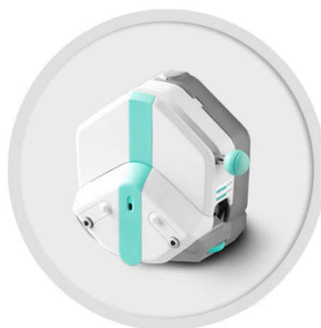
EasyPump 系列 (不可调压)