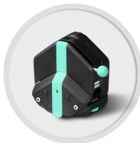
EasyPump-PPS 系列 (不可调压)